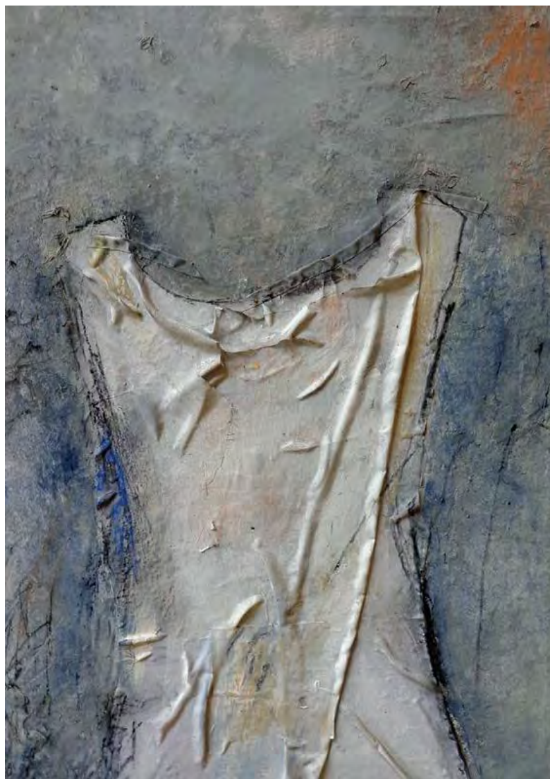
Œuvre d'Elisabeth Pérusset

Exposition du 20 septembre au 13 octobre 2013