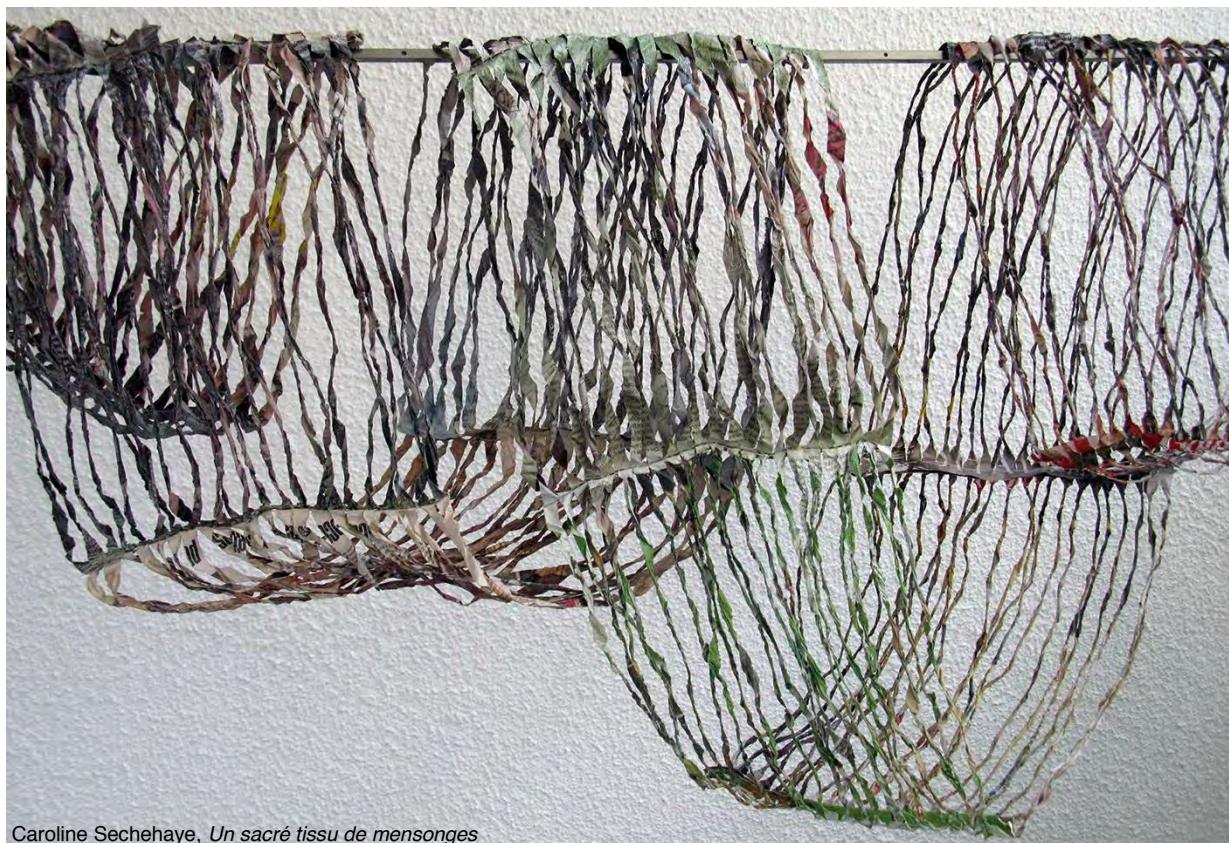
Caroline Secheyahé, Un sacré tissu de mensonges