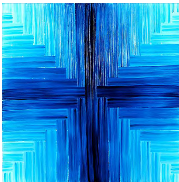
Christelle Montus, Horizon bleu